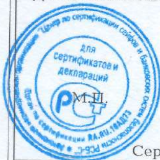
Схема сертификации - 1с